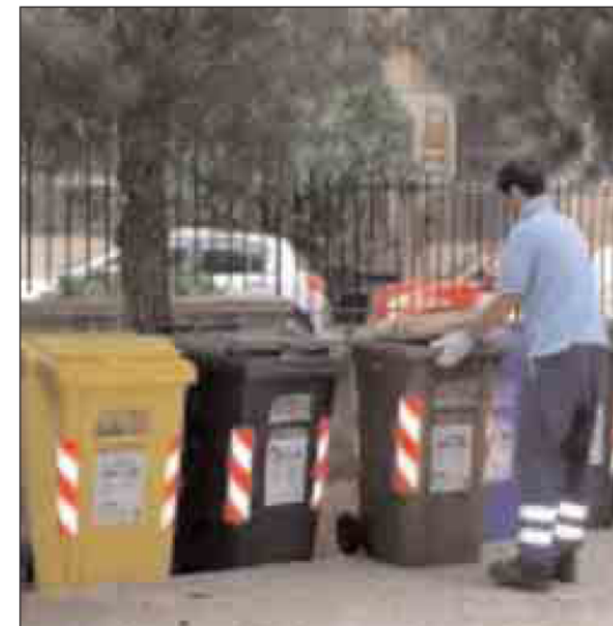
I bidoni della differenziata e la discarica La Martella a Matera

I Comuni già avanti con la differenziata saranno affiancati nei piani di dismissione delle discariche per le quali si prevede la trasformazione in impianti di trattamento dell'organico. «Le criticità maggiori - ha commentato Pietrantonio - restano nell'ambito urbano di Matera e in quello della fascia jonica dove si resta in attesa di assegnazione degli appalti che diano concretezza ai progetti di raccolta differenziata spinta». La palla ora passa alle amministrazioni comunali rimaste indietro rispetto ai piani e alla tabella di marcia fissati dalla Regione e soprattutto ai cittadini la cui responsabilità nell'attuazione dei programmi di gestione differenziata dei rifiuti è fondamentale. Un esempio in tal senso ci viene dal piccolo cen-